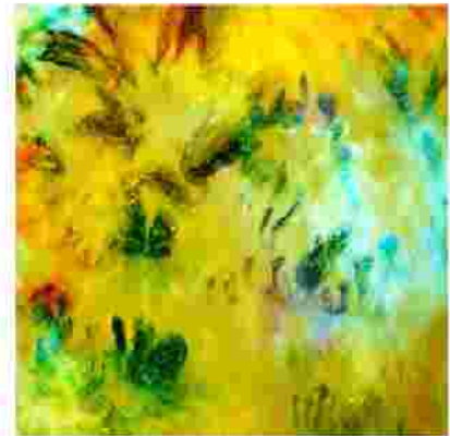
Anacrusis (anacrusis) 100x150cm, 2009 Seide auf Leinwand (silk on canvas)