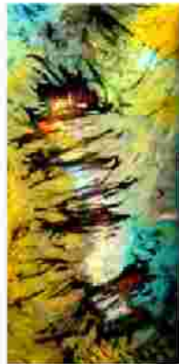
Krise (crisis) 120x100cm, 2009 Seide auf Leinwand (silk on canvas)