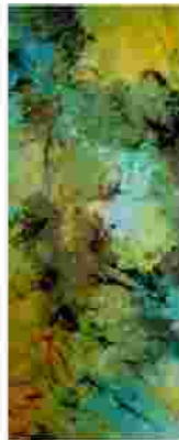
Ungewisse Zukunft (uncertain future) 100x150cm, 2009 Seide auf Leinwand (silk on canvas)