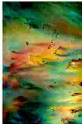
Neue Ideen (new ideas) 120x100cm, 2009 Seide auf Leinwand (silk on canvas)